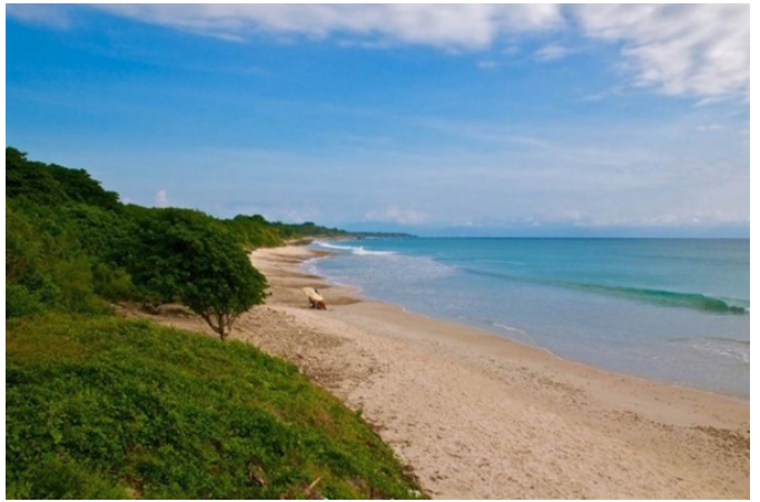
MLS Vallarta es un Servicio de Bienes Raíces ofrecido por Producciones Viva S.A. de C.V.