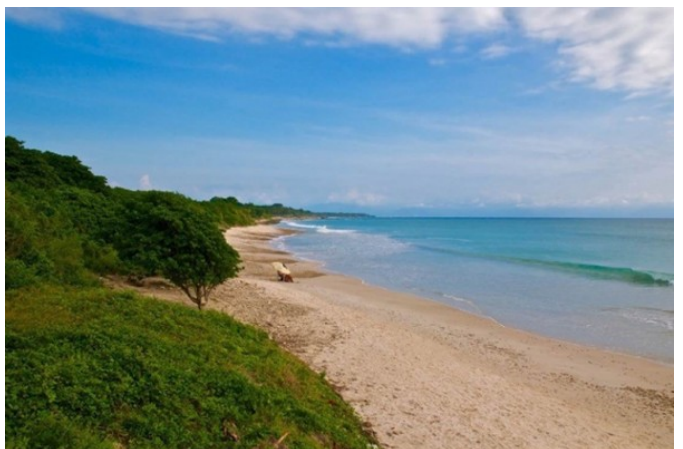
MLS Vallarta es un Servicio de Bienes Raíces ofrecido por Producciones Viva S.A. de C.V.